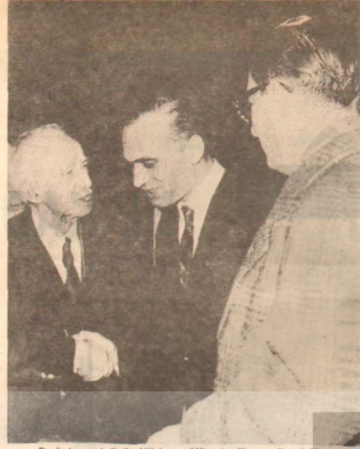
Başbakan İnönü, Müsteşar Müezzinoğlu ve Feyzioglu Kabak, umum müdürlerin başına patladı

Başlangıçta Başbakan ve Başbakan Yardımcıları, durumun fecaatini pek iyi bilmiyorlardı. Nitekim 1962 harcamalarını yüzde 80 oranında gerçekleştiren, Türkiye Kömür İşletmesi temsilcisi fena halde hırpalandı. Temsilci, «Programı yüzde yüz gerçekleştirmek idealdir. Her hedefe varılmaz» diye kendini savunmaya çalıştıysa da, öfkeli bakanlara meram anlatamadı. Ama öbür kurumların durumu ortaya çıkınca, yüzde 80 realizasyon, Sayın Başbakan Yardımcılarına ideal gözükmeye başladı. Nitekim Etibank, meselâ maden ve enerji alanında, öngörülen harcamaların yüzde 50'sini dahi gerçekleştirememişti. Petrol Ofisi, A zot Sanayiinin, Et — Balıkçı kurumları faciaydı. Sümerbank, Türkiye Petrolleri, Şereh Şirketi, Makina — Kimya gibi kurumların durumu iyiceydi. Gerisi berbattı. A