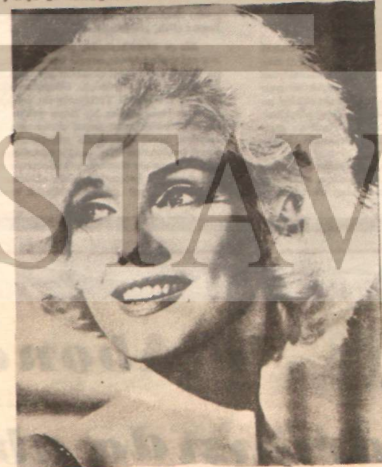
Marilyn Monroe 1962'de sönemiyildi