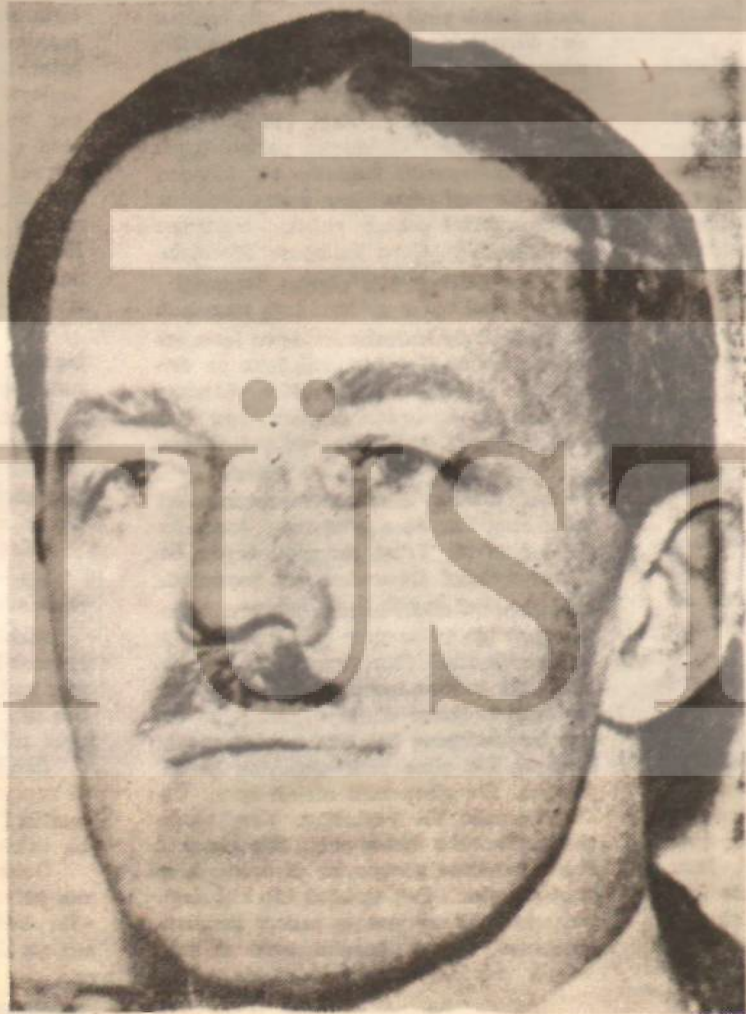
Gizli teşkilâtın başı Allen Dulles

Gözyaşları ile meşhur olan İran Başbakanı Musaddık 1953 yılında koymuştu Bir yandan da Batılı-İngiliz petrol kumpanyalarına el