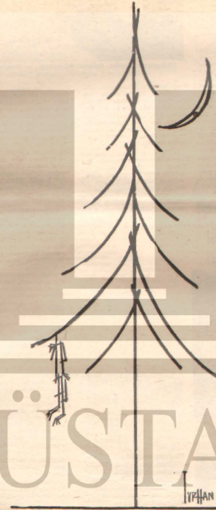
BİR YILBAŞI GECESİ....

Rejim konusunda durum böyle. Peki, iktisadi alanda ne yaptık? Bir yıldır, her fer din dâvası olarak gösterilen kalkınma planı ne şekilde? Durum tek kelimeyle facia.