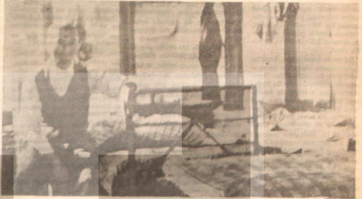
YATAKHANE: Sağlam girilir, romatizma ile çıkarılır...

Bu işleri yoluna koyacağı ümit edilen Yüksek Öğrenim Yurtlar ve Kredi Kurumu ne yaptı? Kurum yöneticileri, kendi görüşlerine göre, mahalle aralarına serpiştirilmiş yurt binalarını temiz etmek ve gene bu şekilde uak yurtlar kurmakla bu işi halle çalışmaktadır. Son Genel Kurul toplantısında, öğrenci temsilcilerinin tenkitleri karşısında bu tutumdan vazgeçileceği tahmin edilebilir. Buna rağmen tutumda ısrar edilirse, bu, büyük bir hatadır.