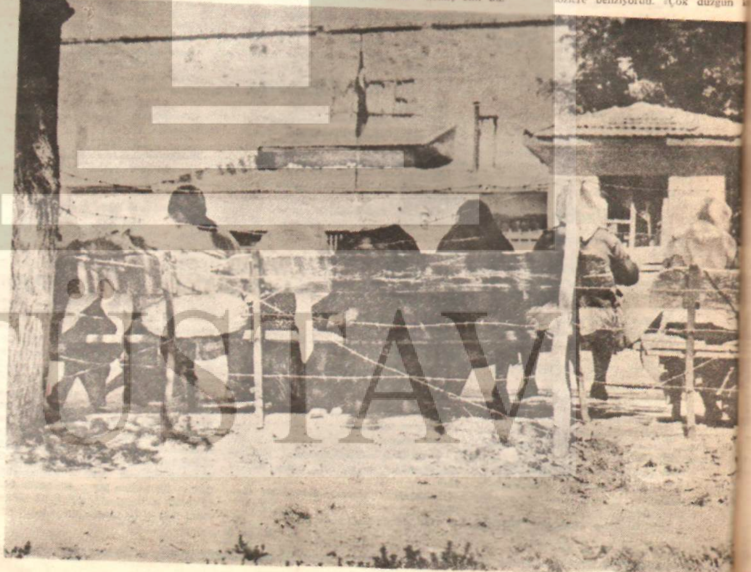
Ankara Merkez Cezaevinin önünde içeridekileri ziyaret için sıra bekleyen kadınlar

«Demek yirmibir aydır tutuklu neden mahkemen bu kadar uzun süredir?» Köylü kızın karşılık vermesine şaşırıp kalmadan sulağımın dibinde ses çınladı: «Adaletin gecikmesi asırlıdır. Başımı çevirip baktım. Deden berf bir duvara yaslanmış herke-tuzak duran uzun boylu, yüzü erke-sivilceleriyle dolu esmer kız, usulce-nima sokulmuştu. Uzun, kıvrıkcık ka-lerim kırpa kırpa, nutuk söylemiş konuşuyordu: «Toplum, suçlu yetim-yüzlere kanun yapıyor. Bunlara ları cezalandıran bir kaç kanunu da-leyiverince adalet sorununu çözümleniyor». Bunlar kitaplardan belle-özlere benziyordu. «Çok düzgün k-