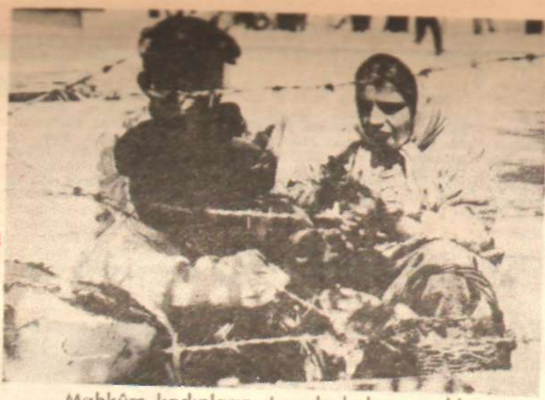
Mahkûm kadınların dışarda kalan çocukları

Yazarlarımızdan Sevgi SANLI, cezaevindeki kadınlarla konuşarak bilmediğimiz bir âlemin perdesini araladı. Yazıyı bu sebeple ilgi ile okuyacağınızı umarız.